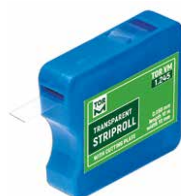
No 1.245 Şeffaf Bant 0,050 mm kalınlık, 10 m uzunluk, 10 mm genişlik