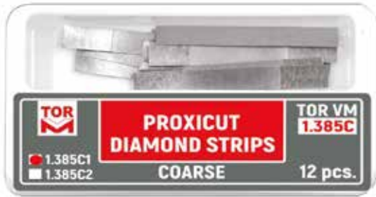
№ 1.385C1 Proxikesim Elmas Stripler, Coarse Tip 1, 0,150 mm kalınlık, 12 adet.