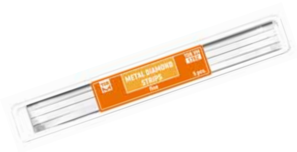
№ 1.152 Metal Elmas Stripler, Fine 5 adet