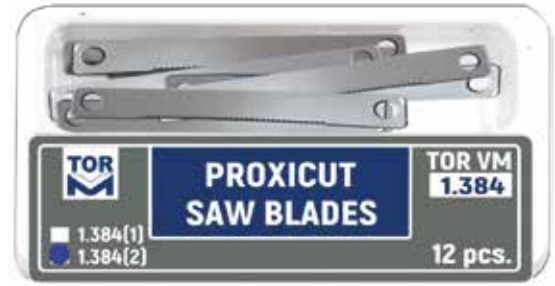
№ 1.384(2) Proxikesim Testere Bıçakları Tip 2, 0,05 mm kalınlık, 12 adet