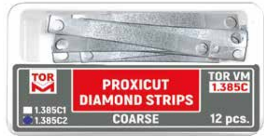
№ 1.385C2 Proxikesim Elmas Stripler, Coarse Tip 2, 0,150 mm kalınlık, 12 adet.