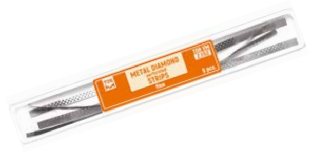
No 2.152 Metal Elmas Perforeli Stripler, Fine (Orta kısım testere) 5 adet