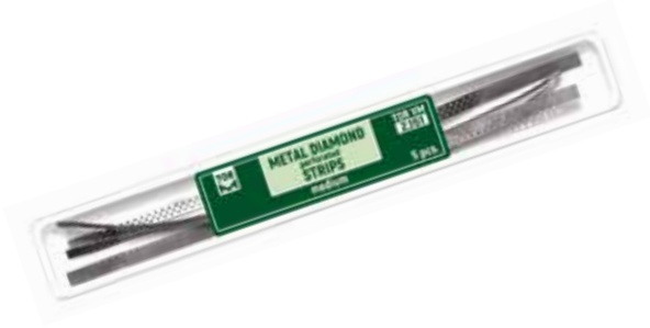
No 2.151 Metal Elmas Perforeli Stripler, Medium (Orta kısım testere) 5 adet