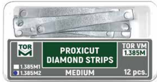
№ 1.385M2 Proxikesim Elmas Stripler, Medium Tip 2, 0,100 mm kalınlık, 12 adet.