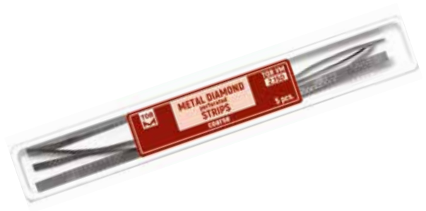
№ 2.150 Metal Elmas Perforeli Stripler (Orta kısım testere) 5 adet