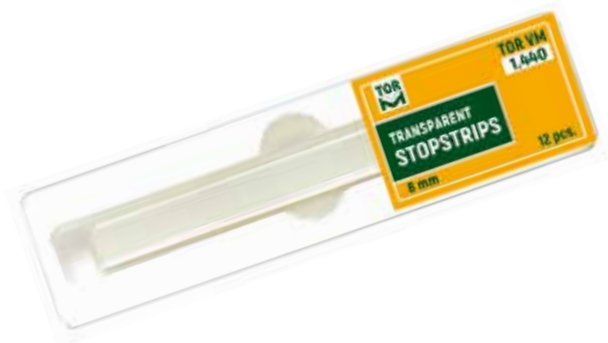
No 1.440 Stoperli Şeffaf Strip Bant 8 mm veya 10 mm genişlik, 100 mm uzunluk, 12 adet