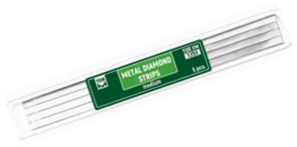
№ 1.151 Metal Elmas Stripler, Medium 5 adet