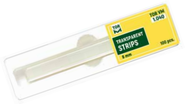
No 1.040 Şeffaf Strip Bant 8 mm veya 10 mm genişlik, 100 mm uzunluk, 100 adet