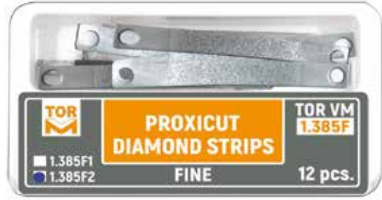
№ 1.385F2 Proxikesim Elmas Stripler Tip 2, 0,070 mm kalınlık, 12 adet.