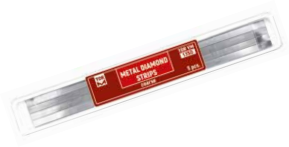
№ 1.150 Metal Elmas Stripler, Coarse 5 adet