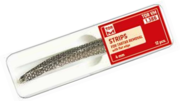
No 1.386 Tartar Kazıma İçin Metal Stripler 12 adet. 4 mm genişlik, 100 mm in uzunluk, 0,05 mm kalınlık