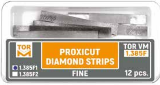
№ 1.385F1 Proxikesim Elmas Stripler Tip 1, 0,070 mm kalınlık, 12 adet.