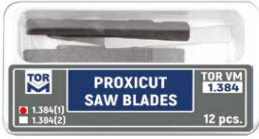
№ 1.384(1) Proxikesim Testere Bıçakları Tip 1, 0,05 mm kalınlık, 12 adet